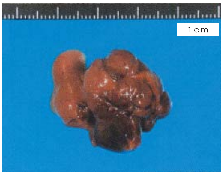
図2. 摘出されたマウスの肝癌