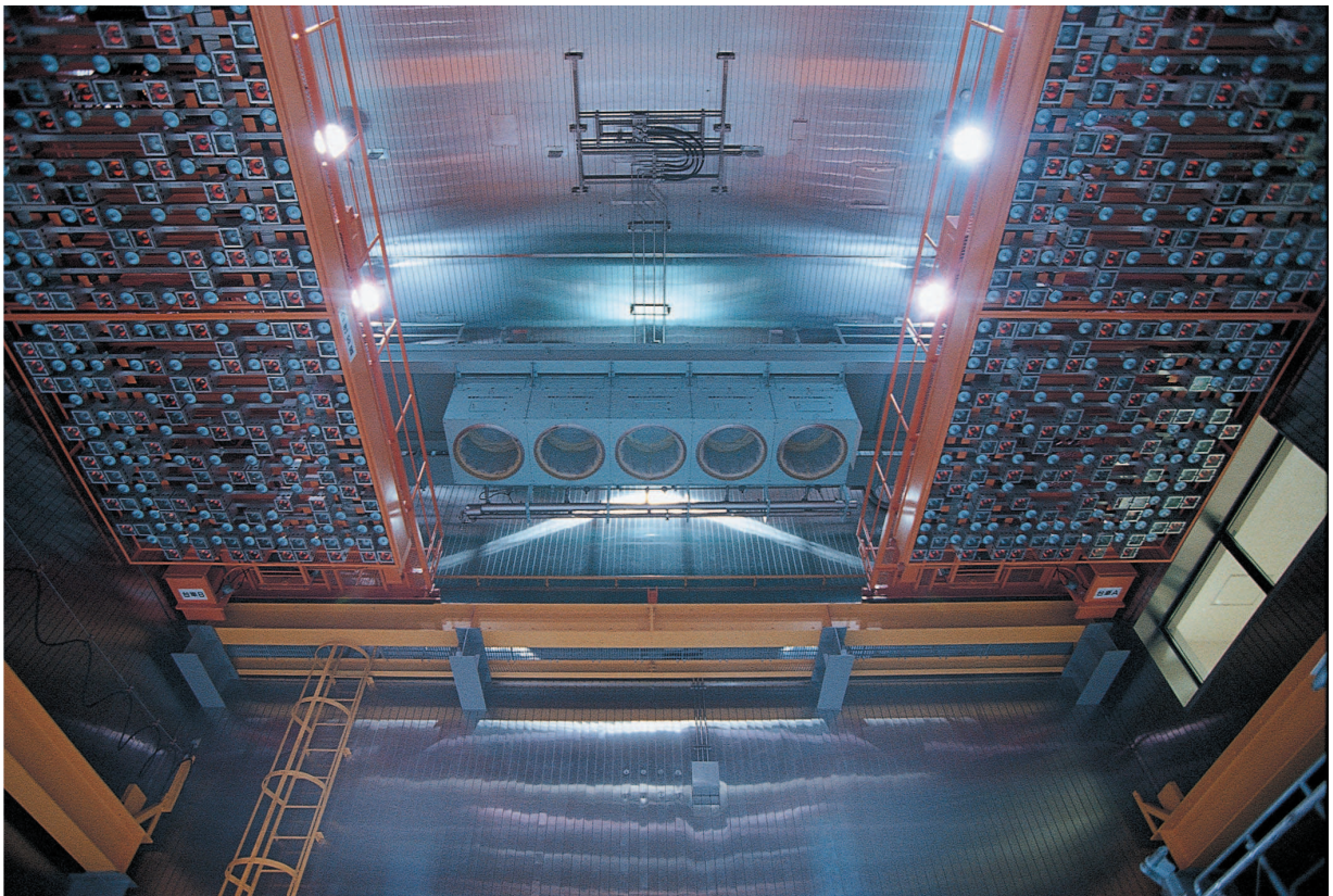
写真1 大型人工気象室内の様子

次に、日射を再現するためのランプを点灯させた様子を写真2に示します。この実験室では、太陽光スペクトルに近似させるために、2種類のランプと特殊なフィルターを組合わせて使用しています。また、実験