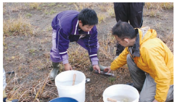
土壌試料採取の様子

試料の調製やイオンクロマトグラフィーを使った測定を行いました。水で薄めた青と赤インクそれぞれが土壌に吸着されて透明になる様子も確認しました。最後に分析結果をまとめてレポートの作成を行いました。慣れない環境、難しい内容にも関わらず、真剣に取り組む姿がとても好印象でした。