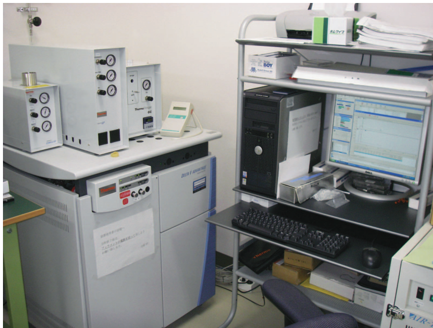
図2 安定同位体を分析するための質量分析器

同じエネルギーで飛ばした時に質量（厳密には質量電荷比）によって飛び方が異なるという原理を利用した機械です。調べたい物質を1分子毎に分けて飛ばし、飛び方の異なるものがどのような割合で観察されるかで、重さの異なる同位体がそれぞれどれだけ含まれているかを明らかにします。