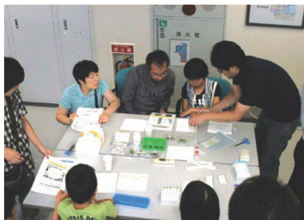
科学体験コーナーの様子

先端分子生物科学研究センターで行われた科学体験コーナー「動物?植物?ミドリムシの不思議な世界」では、ミドリムシから光合成色素を取り出しクロマトグラフィーという方法を使って分離する作業を行いました。光合成色素は数種類あり、植物の種類によって含まれているものが異なる場合や、一部の植物ではもっていないこともあります。そこで、ミドリムシや他の植物、海藻と比較