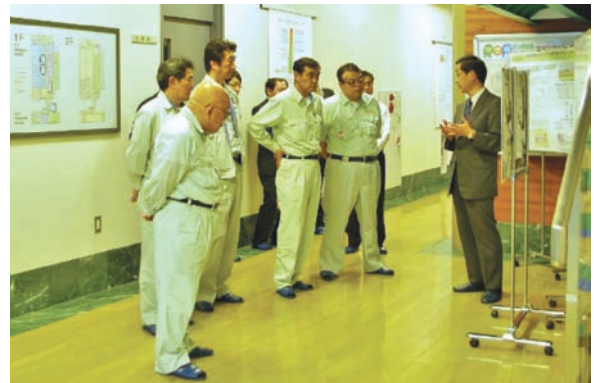
先端分子生物科学研究センターでの様子

見交換を行い、世界で最も低い線量率の放射線を照射できる施設が地元で立地していることに誇りを感じるとのコメントをいただきました。